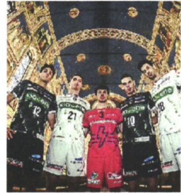
KIOENE Con le stelle di Giotto

ARTICOLO NON CEDIBILE AD ALTRI AD USO ESCLUSIVO DEL CLIENTE CHE LO RICEVE - 4