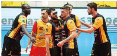
Callipo Vibo Valentia

Una società, due squadre. Una maschile e una femminile. Entrambe hanno raggiunto traguardi importanti. Le ragazze hanno conquistato la Coppa Cev, mentre in campo maschile è arrivata una totalmente inattesa semifinale.