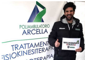
Tusch a Padova: il nuovo palleggiatore della Kioene

Home Padova Calcio Cittadella Volley Altri Sport Cineteca