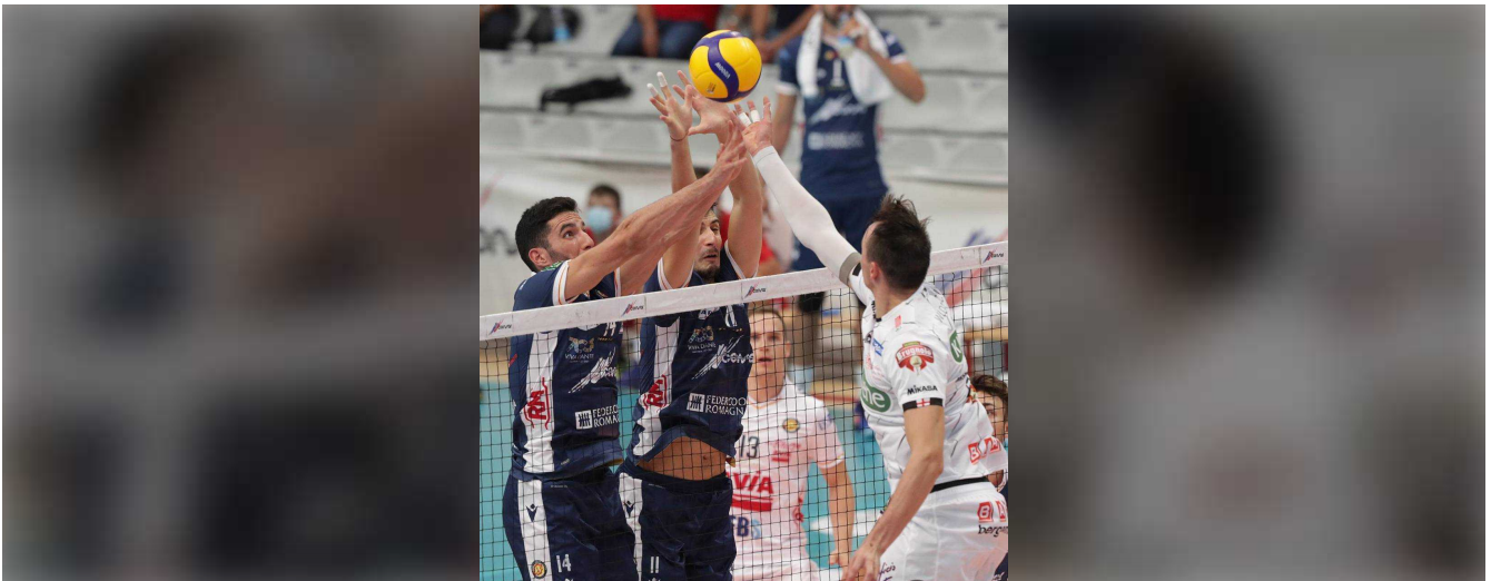
Palla contesa a rete, nella gara di Coppa Italia tra Porto Robur Costa e Kioene Padova disputata al Pala De Andrè