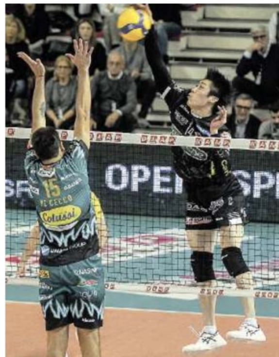
IN AZIONE Yuki Ishikawa è un vero e proprio idolo nel Sol Levante