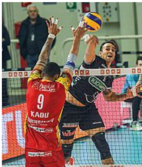
Schiacciata Torres, mvp anche contro Vibo Valentia

● La capolista è seguita a tre lunghezze di distanza dall'Ita, prossima avversaria della squadra padovana nella partita di domani, ore 18, a Trento