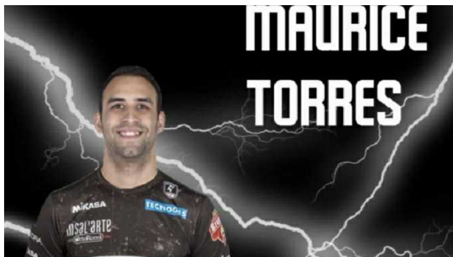
Ufficio Stampa Kioene