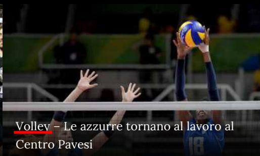
Volley - Le azzurre tornano al lavoro al Centro Pavesi