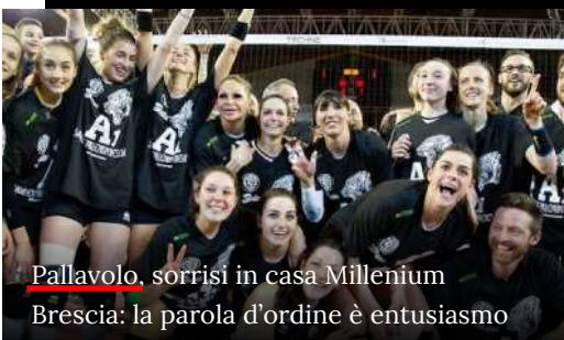
Pallavolo, sorrisi in casa Millenium Brescia: la parola d'ordine è entusiasmo