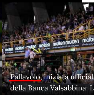
Pallavolo, iniziata ufficial della Banca Valsabbina: L campo per il primo