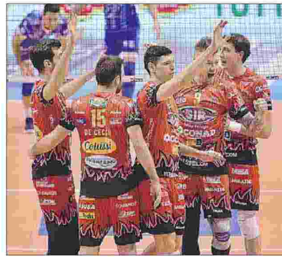
Al top La Sir Safety Conad ha chiuso in testa alla classifica da sola e ora al giro di boa vuole mantenere la posizione di prestigio conquistata con merito