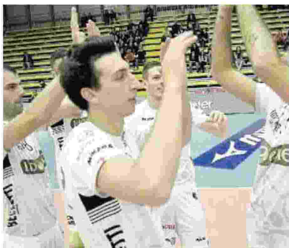
PRIMA VITTORIA Da Vibo Valentia, oltre ai tre punti, nuova fiducia