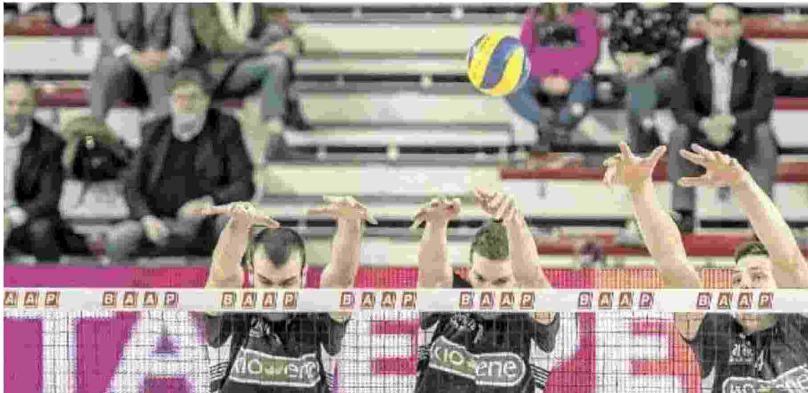
LA TRASFERTA Per rendere la vita dura agli umbri e bianconeri dovranno esprimersi al meglio in tutti i fondamentali, muro compreso