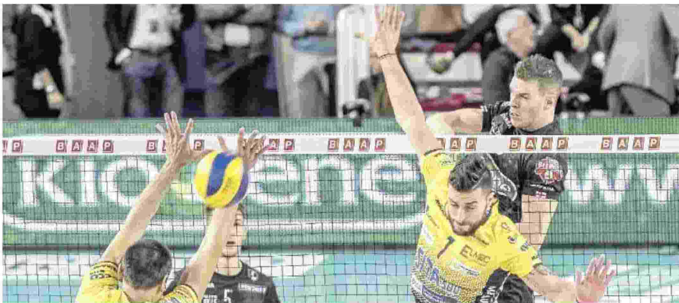
SERATA POSITIVA Un attacco di Volpato: la Kioene ha battuto in tre set la neopromossa Bcc Castellana Grotte e adesso si prepara a sfidare Piacenza