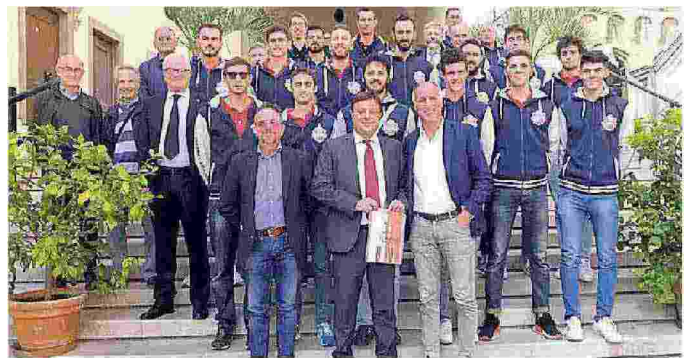
Il Valsugana Padova alla presentazione di Palazzo Moroni

Kioene Padova: Peslac 4, Nelli 8, Polo 12, Volpato 6, Cirovic 8, Randazzo 6, Balaso (libero); Koprivica, Sperandio, Gozzo, Premovic 6. Non entrati: Veronese, Yoder, Scanferla (libero). All. Baldovin. (di.zil.)