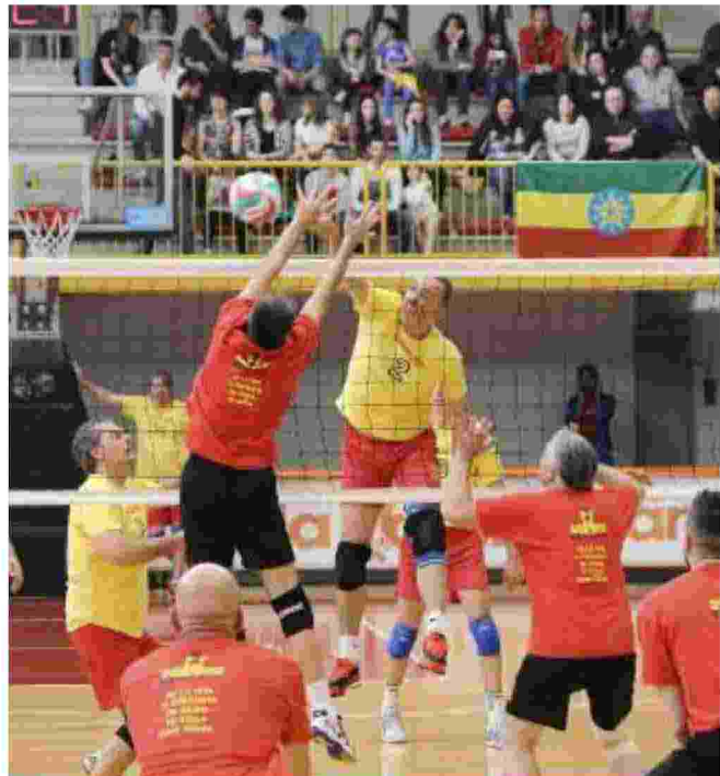
Un momento di una scorsa edizione del memorial Livio Romare

E quindi non poteva mancare la voce del volley per eccellenza, quel Lorenzo Dallari già commentatore di Tele+ e ex vice direttore di Sky Sport. •