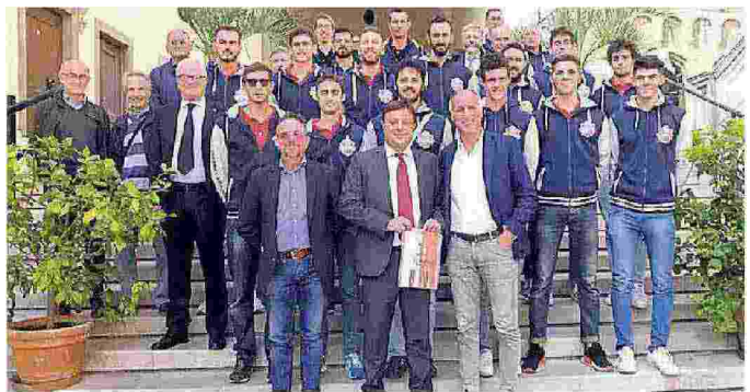
Il Valsugana Padova alla presentazione di Palazzo Moroni

Kioene Padova: Peslac 4, Nelli 8, Polo 12, Volpato 6, Cirovic 8, Randazzo 6, Balaso (libero); Koprivica, Sperandio, Gozzo, Premovic 6. Non entrati: Veronese, Yoder, Scanferla (libero). All. Baldovin. (di.zil.)