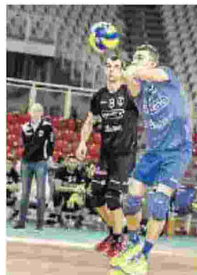
BIANCONERI Segnali di crescita