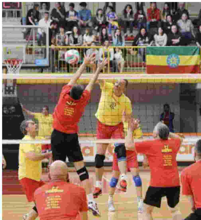
Un momento di una scorsa edizione del memorial Livio Romare