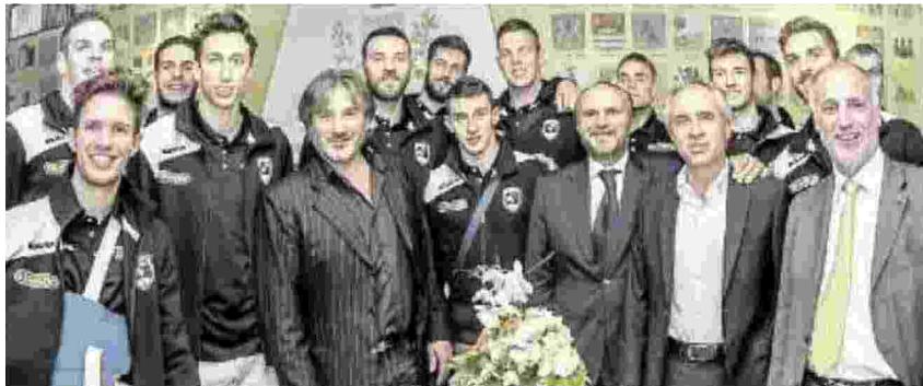
CENA A VILLA TACCHI La Kioene presentata a soci, sponsor e media nella serata di gala a Gazzo Padovano