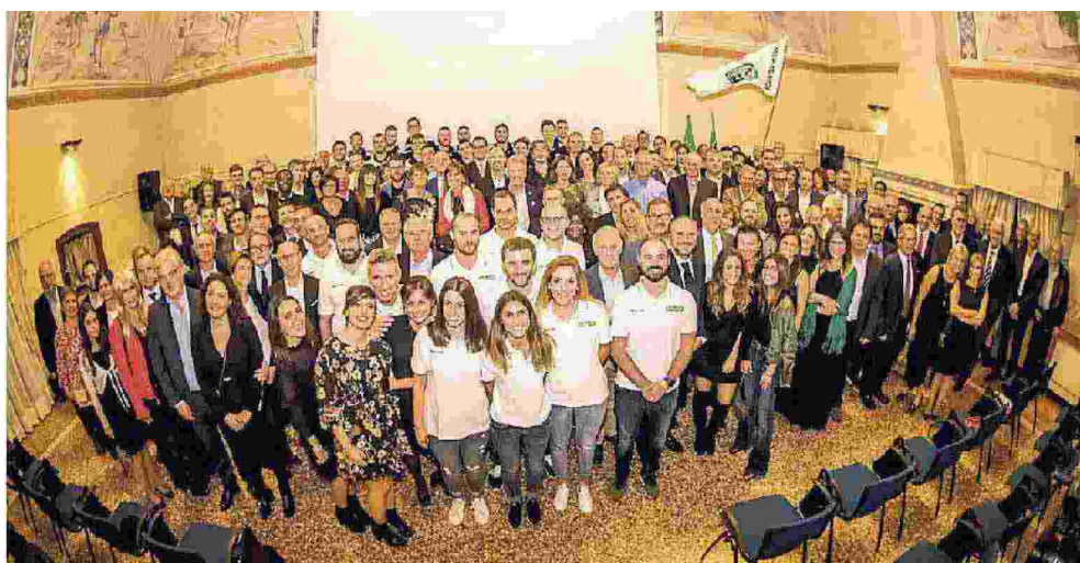
Foto di gruppo, con soci, sponsor e dirigenti, oltre a squadra e tecnici, della Kioene Padova a Villa Tacchi

Sconfitti 3-1 i tedeschi del Rhein-Main di Francoforte Baldovin prova Koprivica. A Schio amichevole con Trento