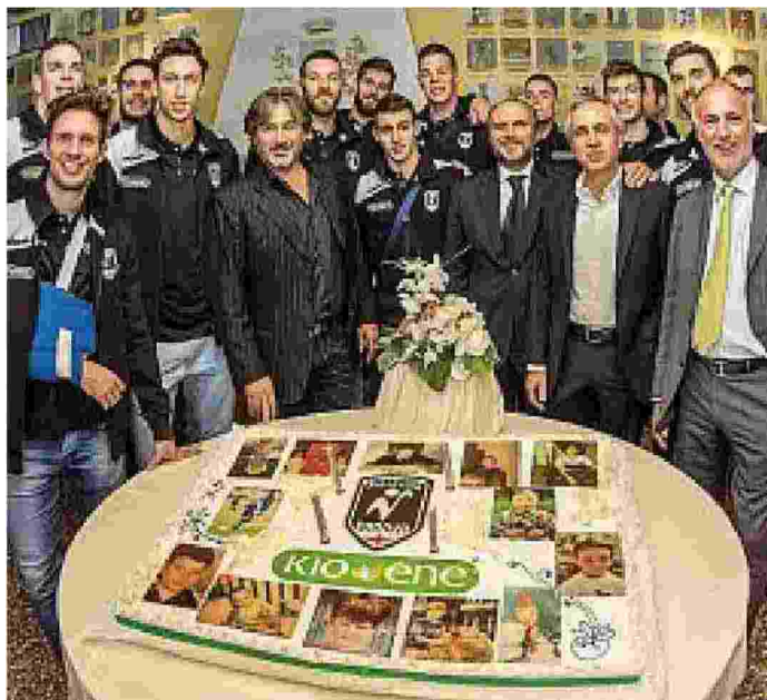
Festa prima del debutto Mercoledì match in Coppa Italia contro Castellana