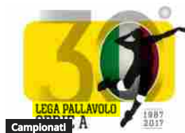
Superlega A1 Unipolsai: Tutto il calendario 2017/18

Campionati Raduni: Sora prima in palestra