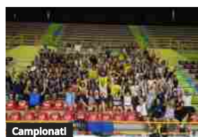
Verona: 200 tifosi al primo "meet&greet"

Campionati Raduni: Sora prima in palestra