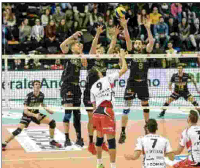
TIFOSI La Kioene ha totalizzato una media di 2700 spettatori a partita

Una situazione molto difficile da gestire, perché non sarà davvero facile privarsi in un solo colpo di quattro squadre, alcune delle quali "storiche" per il volley italiano. Per ora non ci sono indiscrezioni. Tutti aspettano la conclusione del campionato per poi iniziare a discutere di una cosa che, a rigore di logica, non dovrebbe avere molte alternative, visto che il regolamento di Lega parla chiaro. Ma che potrebbe accompagnarci per molte settimane.