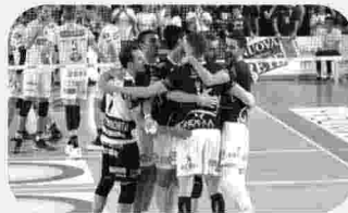
I GIOCATORI SORANI