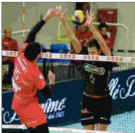
BUONA PROVA Giannotti e compagni hanno reso la vita difficile a Piacenza

Peccato solo che da Sora sia arrivata la notizia del successo della Globo per 3-1 su Vibo Valentia, una vittoria che permette alla squadra di Mattia Rosso il sorpasso sulla Kioene al terz'ultimo posto in classifica. Sora è ora a quota 20, un punto in più di Padova, e domenica prossima ci sarà lo scontro diretto alla Kioene Arena. In mezzo, per Padova, la trasferta a Verona e, per Sora, il turno casalingo con Ravenna. In palio il terz'ultimo posto che regala la possibilità di giocare l'eventuale bella in casa nel primo turno dei play off per il quinto posto. Un qualcosa che non cambia la vita, ma che in questo momento è comunque un traguardo importante.