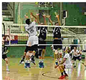
Ultima spiaggia Occasione d'oro

Anche Milano, però, aspetta la trasferta di Padova come