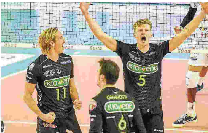
La Kioene esulta dopo una vittoria: non accade dal 13 novembre