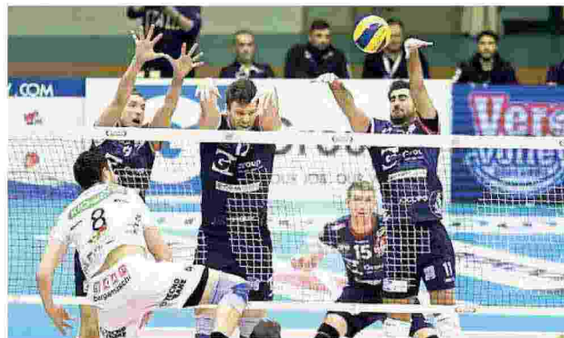
Muro inesorabile di Monza su un attacco di Maar

Note: durata set 26', 26', 25', 37'. Monza battute vincenti 7, battute sbagliate 19, muri vincenti 12, ricezione 48% (ricezione perfetta 23%), attacco 43%, errori 26. Padova: bv 4, bs 22, mv 7, ric. 38% (ric. perf. 22%), att. 43%, err. 35. Spettatori 1.503, incasso non comunicato.