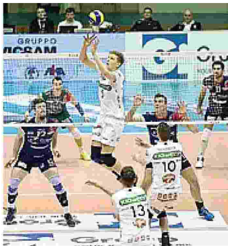
A corrente alternata Shaw in palleggio, regia da migliorare

Note: Durata set: 26', 26', 26', 36'; tot: 114'