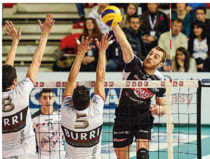
Per Mattia Rosso potrebbe essere stata l'ultima stagione a Padova